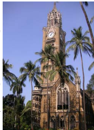
University of Mumbai

willkommen zur September-Ausgabe unseres Newsletters! Seit dem letzten Newsletter hat sich in Indien einiges getan: Am 15. August feierte Indien seine 60-jährige Unabhängigkeit und erstmals wurde eine Frau zum indischen Staatsoberhaupt gewählt. Für uns beweist Indien damit wieder einmal, dass auch in einem Land mit über einer Milliarde Menschen, mit hunderten verschiedenen Sprachen, einer Vielzahl von Religionen und denkbar ungleichen sozialen Verhältnissen, eine funktionierende Demokratie möglich ist: Danke, Indien!