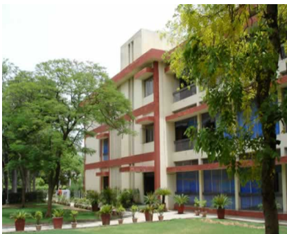
Delhi School of Economics

Nach meinem Diplom in Wirtschaftswissenschaft bin ich für ein Jahr an die Delhi School of Economics gegangen, um dort meine Promotion in VWL über die dortige Verschränkung von Wettbewerbsregeln mit kulturellen Regeln am globalen Arbeitsmarkt vorzubereiten. Das war 2000 und Indien war noch keineswegs Thema in Deutschland. Indien wurde wahrgenommen als Schwellenland und nicht als BRIC-Staat; als Schwellenmacht und nicht als Atommacht. Das Internet boomte zur Jahrtausendwende und Outsourcing steckte in den Kinderschuhen. Dementsprechend gab es eine nur kleine Zahl deutscher Studierender in Indien und die bürokratischen Hürden vom Erstkontakt bis zur Einschreibung spotten jeder Beschreibung. Insgesamt habe ich etwa drei Jahre Vorbereitungen eingebracht, bis ich schließlich durch den DAAD gefördert an der Delhi University und dort an der Delhi School of Economics studieren konnte. Die Delhi University ist mit ihren rund 300.000 Studenten eine der größten Universitäten der Welt. Was abschreckend klingt, relativiert sich aber dadurch, dass die DU in eine Vielzahl von Colleges und Schools unterteilt ist, innerhalb derer sich konzentriert und fachlich spezialisiert stu-