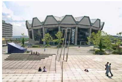
Audimax Ruhr Universität Bochum

Question: Soon after you came to Germany, you decided to apply for a scholarship and got awarded with a scholars-