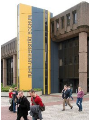
Verwaltungsgebäude der RUB

Answer: I came to Germany to participate in an international cultural exchange programme in 2003, through which I got interested in European culture and German language. As I wanted to improve my language and to advance my studies in Economics, I opted for this programme.