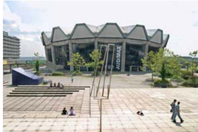
Audimax Ruhr Universität Bochum

Question: Soon after you came to Germany, you decided to apply for a scholarship and got awarded with a scholars-