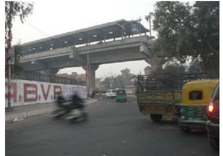
Verkehr in Delhi

mus in Indien durch die schiefe Flut an Studienplatzbewerbungen, die aus dem 1,1 Mrd. Einwohnerland stammen, um ein vielfaches schärfer ist als in Deutschland.