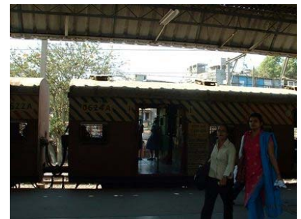
Local Trains in Mumbai

umgekehrt muss man allerdings auf Busse ( www.bestundertaking.com ), Taxen oder Rickshaws umsteigen. Rickshaws fahren nur in den Vororten nördlich von Bandra, so dass man im Stadtkern auf Taxen angewiesen ist. Der Mindestpreis für eine Rickshaw liegt bei 9 Rupien, bei Taxen sind es 13 Rupien. Da es sich noch um alte Taxometer handelt, muss der angezeigte Preis in den tatsächlichen Fahrpreis umgerechnet werden. Umrechnungstabellen gibt es in den Fahrplänen für die Local Trains an den Bahnhöfen zu kaufen. Während des Berufs-