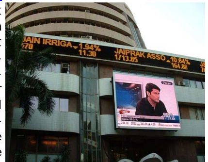
Dalal Street in Mumbai (Börse)