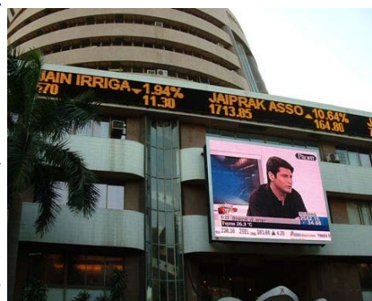
Dalal Street in Mumbai (Börse)

Hinsichtlich der Vernetzung von deutschen und indischen Akademikern gibt es gleich zwei erfreuliche Neuigkeiten zu berichten. Zum einen hat die Universität Jena eine neue Plattform zum Thema interkulturelle Kommunikation zwischen Deutschland und Indien an den Start gebracht ( www.interkulturelles-portal.de/indien ). Zum anderen hat die Freie Universität Berlin (FU) am 28. Februar 2008 in Zusammenarbeit mit dem DAAD eine neue Repräsentanz in New Delhi eröffnet. Es bestehen nunmehr Partnerschaften mit der University of Delhi, der Jawaharlal Nehru University, dem Indian Institute of Technology Roorkee (IIT) sowie dem Energy and Resources Institute (TERI); Themen wie die wechselseitige Anerkennung von Studienleistungen (Credit-Transfer) und die Einrichtung indischer Stiftungslehrstühle in Deutschland sind im Gespräch (weitere Informationen unter www.fu-berlin.de/india ).