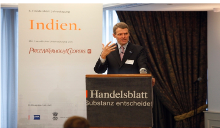
Hauptgeschäftsführer der AHK-Indien