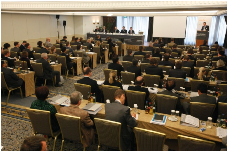
5. Handelsblatt Konferenz im Hotel Palace Berlin

Am 3–4. Dezember 2009 fand die 5. Handelsblatt Jahrestagung Indien in Berlin statt. Auf der Konferenz – die sich als