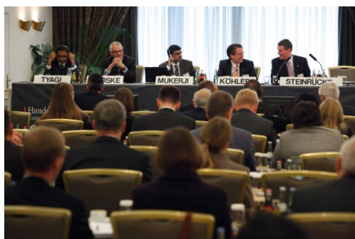
5. Handelsblatt-Konferenz Indien in Berlin